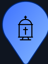
Figura cerimonial apontando para o céu